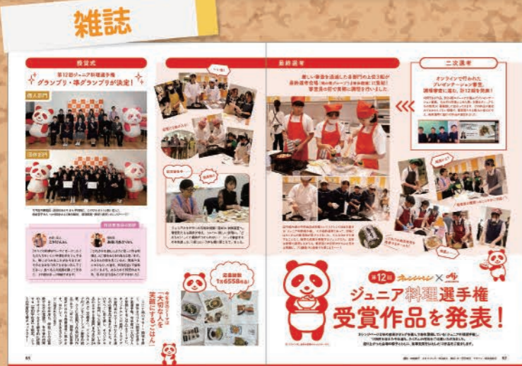
『オレンジページ』 2025年1月31日発売号

第12回のグランプリ・準グランプリの生徒・学校が複数メディアに取り上げられました。