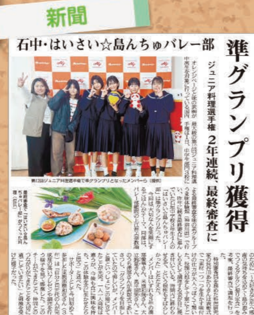
八重山毎日新聞 2024年12月4日掲載