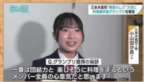
6:42 三本木高校「青森らしさ」大賞に料理選手権グランプリを掲載 Q.グランプリ獲得の秘訣 一番は回結力と、楽しそうに料理をするというメンバー全員の心意気だと思います