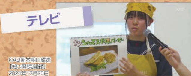
KAB熊本朝日放送 『知って得!見聞録』 2024年12月23日