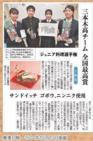
東奥日報 2024年12月13日掲載