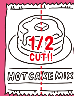
ホットケーキ ミックス