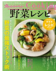
2/5発売 2018野菜レシピ 978-4-86593-199-0 A4変/中綴じ 本体546円+税