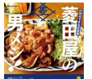
11/4発売 菱田屋の男メシ! 978-4-86593-188-4 AB/平綴じ/ 本体1203円+税