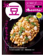
3/17発売 Vol.30 豆 978-4-86593-208-9 B5変/中綴じ 本体333円+税