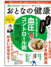
4/16発売 おとなの健康Vol.7 978-4-86593-212-6 A4変/平綴じ 本体648円+税