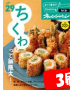
2/17発売 Vol.29 ちくわ 978-4-86593-202-7 B5変/中綴じ 本体333円+税