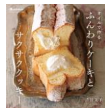
1/22発売 オイルで作る ふんわりケーキと サクサククッキー 978-4-86593-196-9 A4変/平綴じ 本体800円+税