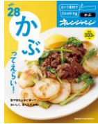
2/17発売 Vol.28 かぶ 978-4-86593-201-0 B5変/中綴じ 本体333円+税