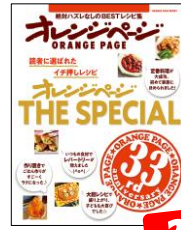
1/30発売 オレンジページ THE SPECIAL 978-4-86593-198-3 A4変/平綴じ/本体741円+税