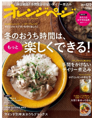
『オレンジページ』2020年12月2日号

2020年9月17日・10月2日合併号より、連載「TRY & Happy ♪～私たちのSDGs」をスタート。毎回、オレンジページ編集部員がやってみた<環境や社会にちょっといいこと>を紹介。SDGsをもっと身近に感じてもらえるような、オレンジページらしいアプローチで情報を発信中。