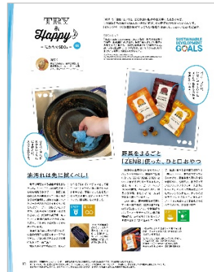
連載「TRY & Happy ♪～私たちのSDGs」