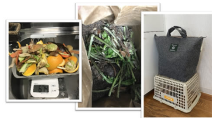
社内キッチンでのコンポスト活動の様子