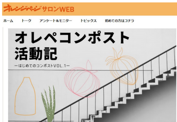
オレンジページサロン WEB「オレペコンポスト活動記」