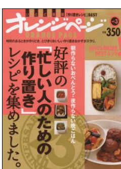
好評の 「忙しい人のための 作り置き」レシピを集めました。