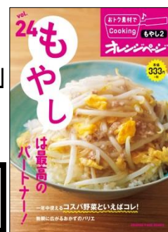
おトク素材で Cooking♪ Vol.24 もやし