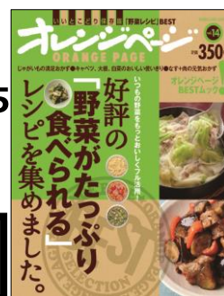
好評の 「野菜がたっぷり 食べられる」 レシピを集めました。