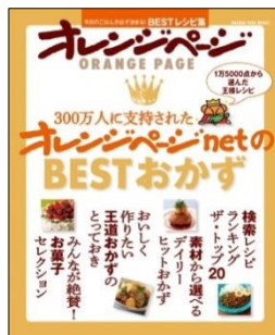
300万人に支持された オレンジページnetの BESTおかず