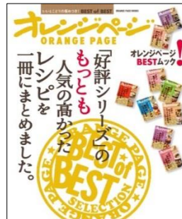
「好評シリーズ」のもっとも 人気の高かったレシピ