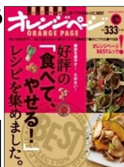
好評の 「食べて、やせる!」 レシピを集めました。