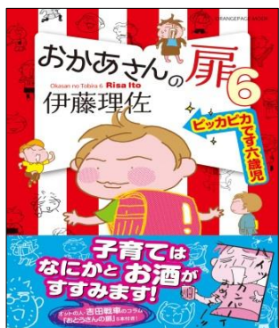
おかあさんの扉6 伊藤理佐：著