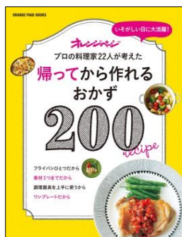
帰ってから作れる おかず200