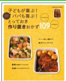
とっておき 作り置きおかず109