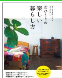
女ひとりの 楽しい暮らし方